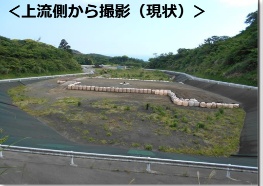
<上流側から撮影（現状）>